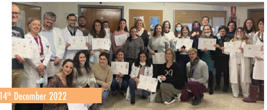
14 th December 2022

Moreover, for a second year in a row specific training webinars were developed by the Committee in order to strengthen the competence of IdiPAZ members in quality management, thus ensuring the sharing of best practices among them. These webinars are accessible at IdiPAZ website: https://idipaz.es/PaginaDinamica.aspx?IdPag=20&Lang=ES