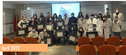
6 th April 2022