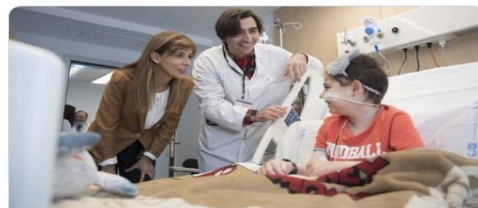
Abre en Madrid una unidad puntera que fusiona el tratamiento y la inv... El hospital de La Paz inaugura con la Fundación CRIS Contra el Cáncer el nuevo departamento científico y sanitario elpais.com